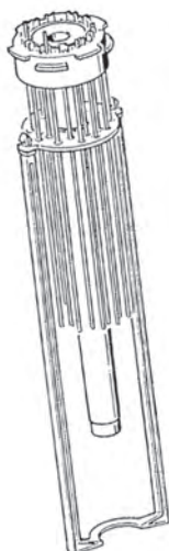
Patentierter Auszug zur einfachen Reinigung der Lampe und des HV-Gitters