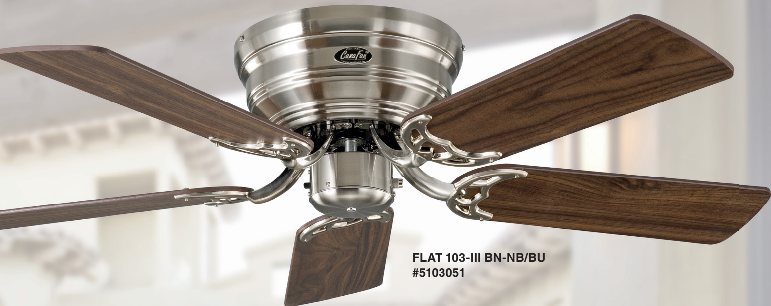
FLAT 103-III BN-NB/BU #5103051