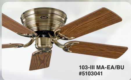
103-III MA-EA/BU #5103041