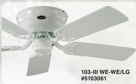
103-III WE-WE/LG #5103061