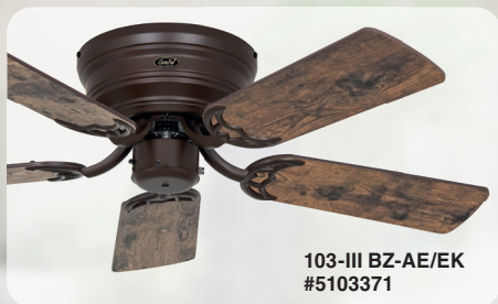
103-III BZ-AE/EK #5103371