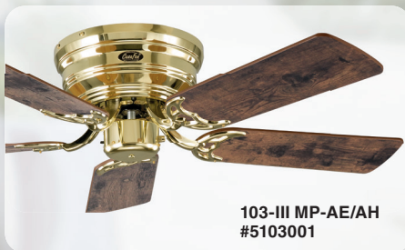
103-III MP-AE/AH #5103001

EXTRAFLACH! Besonders geeignet für niedrige Räume