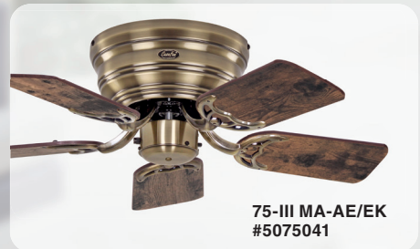
75-III MA-AE/EK #5075041

EXTRAFLACH! Besonders geeignet für niedrige Räume