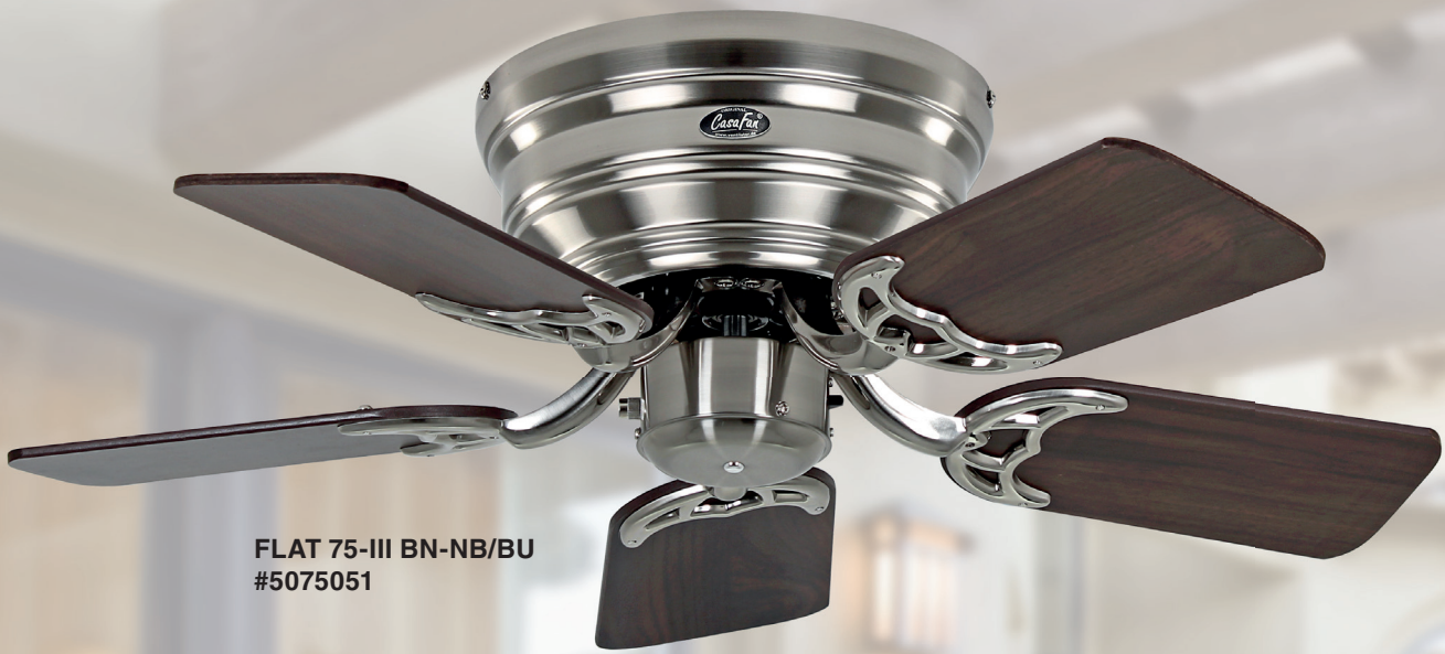
FLAT 75-III BN-NB/BU #5075051