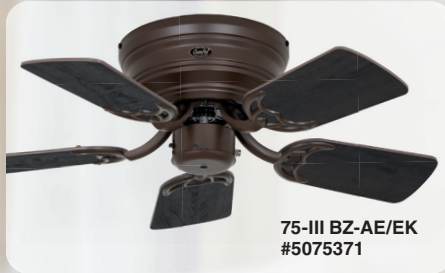
75-III BZ-AE/EK #5075371