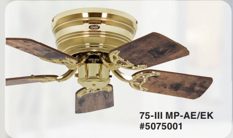
75-III MP-AE/EK #5075001