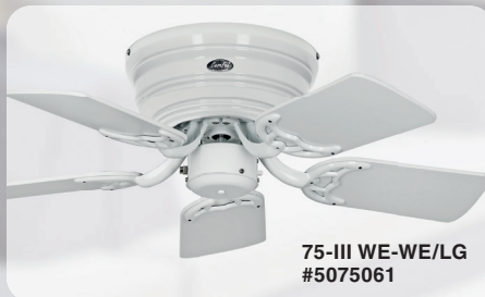
75-III WE-WE/LG #5075061