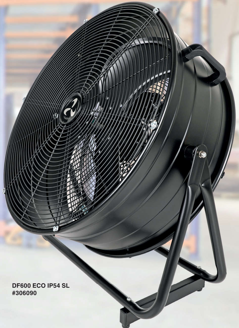
DF600 ECO IP54 SL #306090