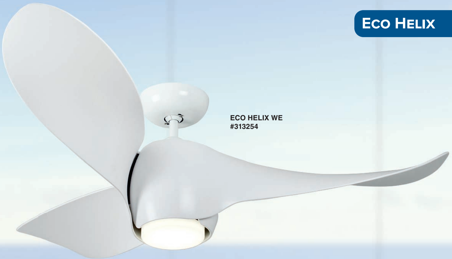
ECO HELIX WE #313254