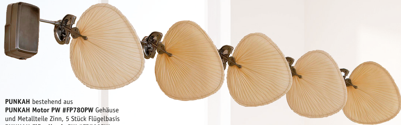
PUNKAH bestehend aus PUNKAH Motor PW #FP780PW Gehäuse und Metallteile Zinn, 5 Stück Flügelbasis PUNKAH Flügelbasis PW #FP720PW Metallteile Zinn und 5 Stück Flügel Palme natur, #PUP1