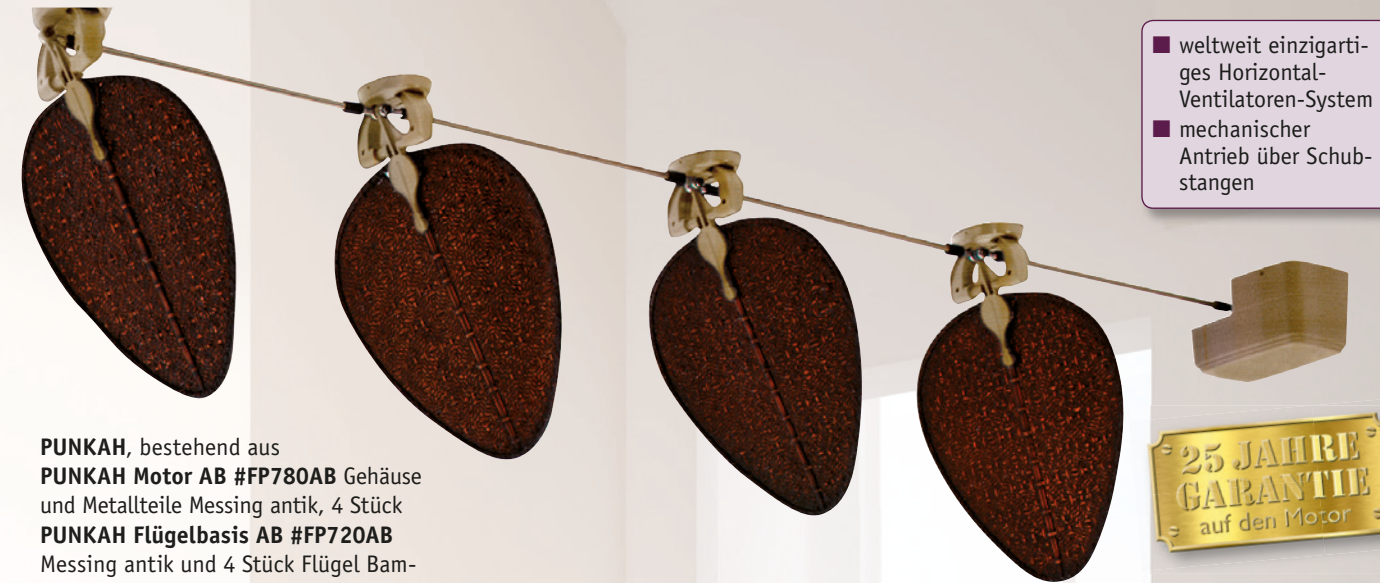
PUNKAH, bestehend aus PUNKAH Motor AB #FP780AB Gehäuse und Metallteile Messing antik, 4 Stück PUNKAH Flügelbasis AB #FP720AB Messing antik und 4 Stück Flügel Bam- bus antik #PUD4A

Nicht empfohlen für geräuschempfindliche Bereiche (z.B. Schlafzimmer). Einheit liefert keinen signifikanten Luftstrom.