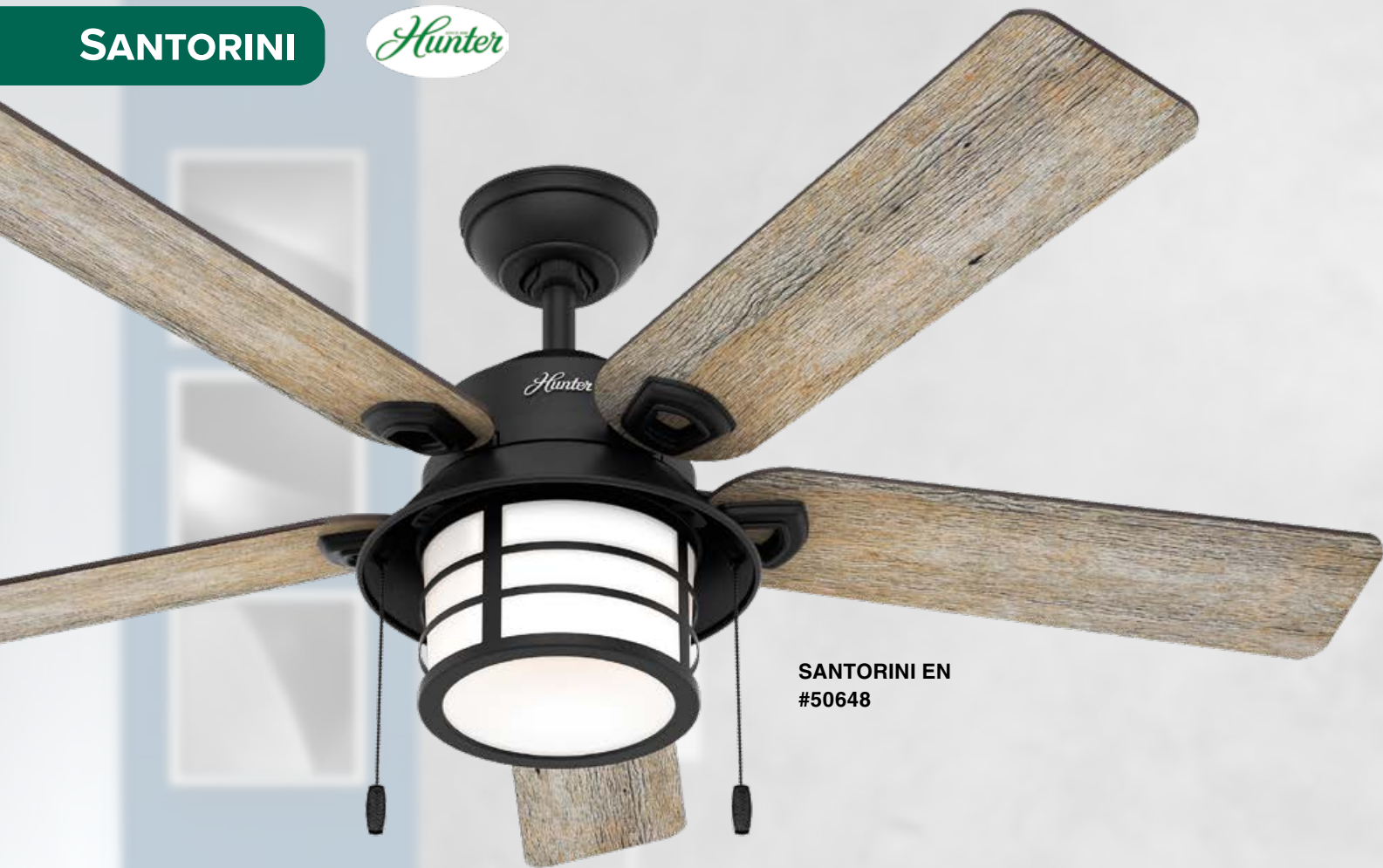
SANTORINI EN #50648